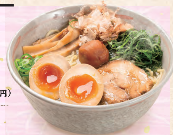
味玉梅じそらーめん