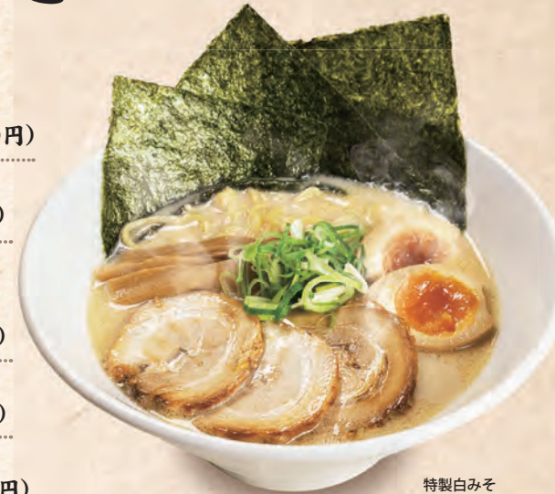
特製白みそとんこつ