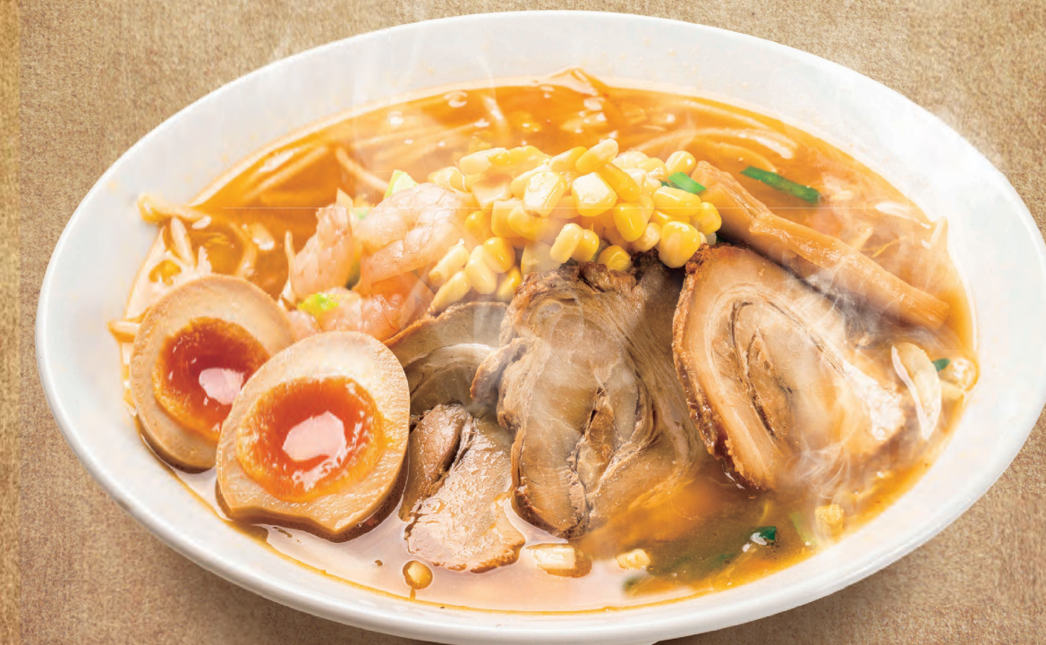
特製灯台らーめん