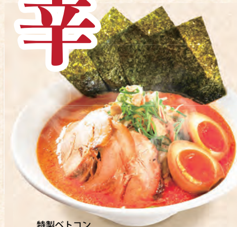
特製ベトコンらーめん